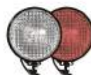
фары на СИМ