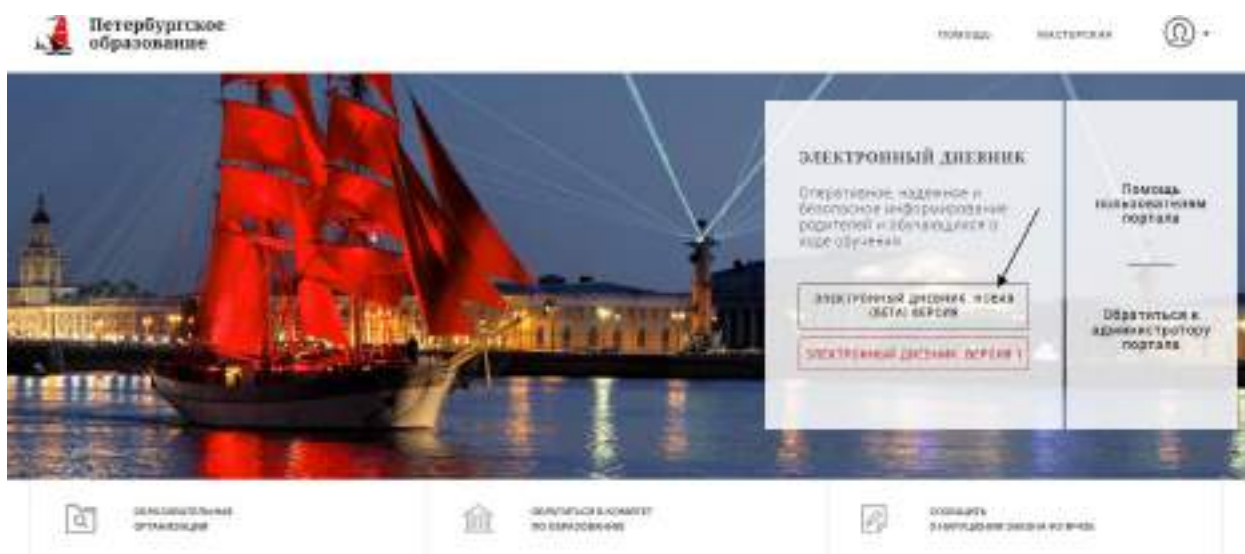
Рисунок 1 – Главная страница на «Портал Петербургское образование»

Прежде чем подать заявление на подключение к сервису, родитель должен пройти регистрацию на портале «Петербургское образование». После получения на эл. почту логина и пароля для входа на портал Пользователю необходимо авторизоваться и перейти к новой версии Электронного дневника, как показано на Рисунке 1.